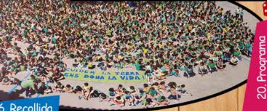
6. Recollida de piles